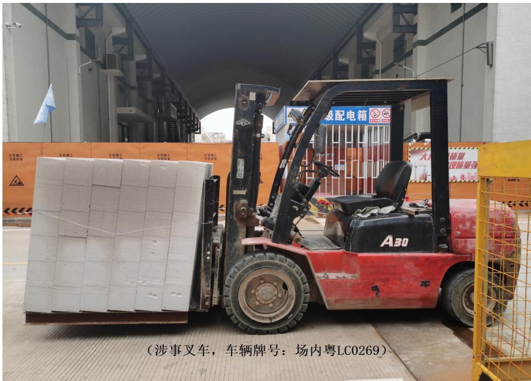
(涉事叉车，车辆牌号：场内粤LC0269)