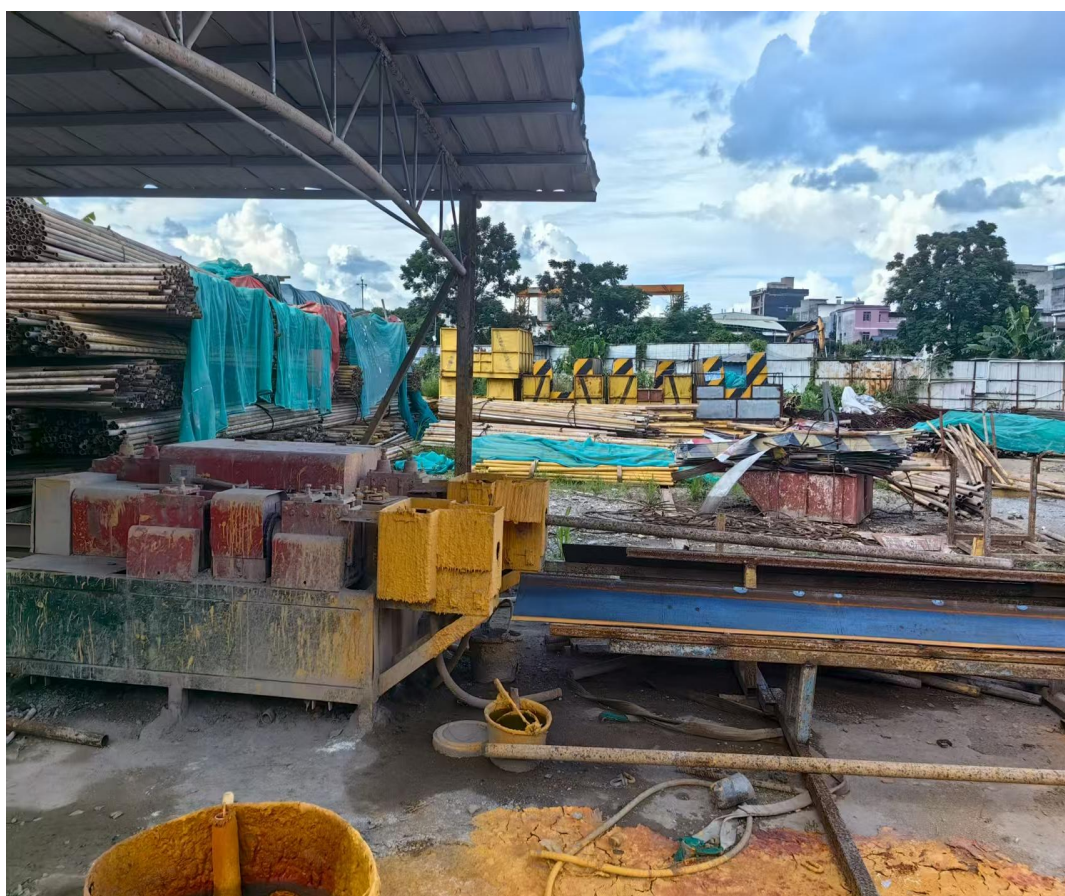
图3 脚手架钢管的堆放场地

现场勘查情况：事故发生地点为河源市源祥劳务有限公司脚手架钢管堆放场地，场地周围堆放较多的钢管，都是等待调直的脚手架钢管，现场设备已停用。