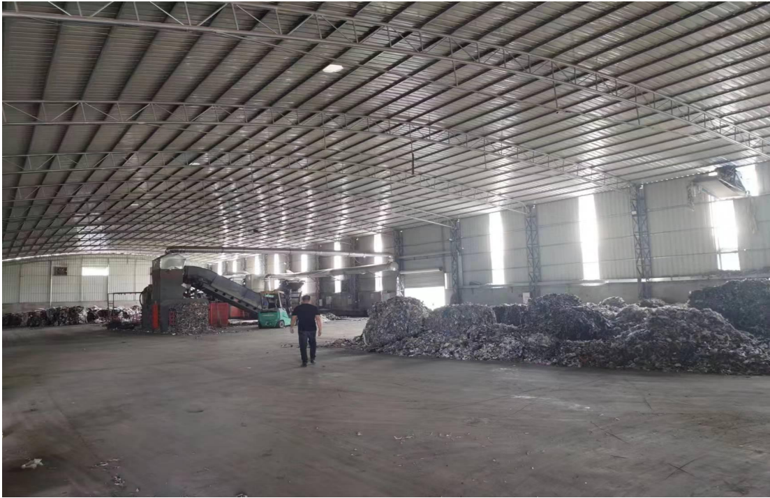
河源市***有限公司车间