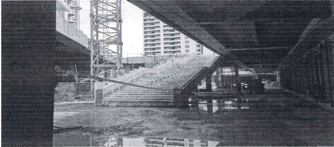
坚基·春天里一标段工程在建5栋